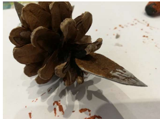
den Schwanz an die Zapfenspitze kleben