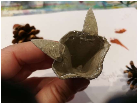
Ohren zuerst innen ankleben

Du kannst auch andere Tiere basteln! Da sind dir keine Grenzen gesetzt! Auf dem folgenden Bild siehst du zum Beispiel einen Fuchs. Dafür brauchst du noch Ohren (sie werden mit Bleistift aufgezeichnet und dann ausgeschnitten) und einen buschigen Schwanz.